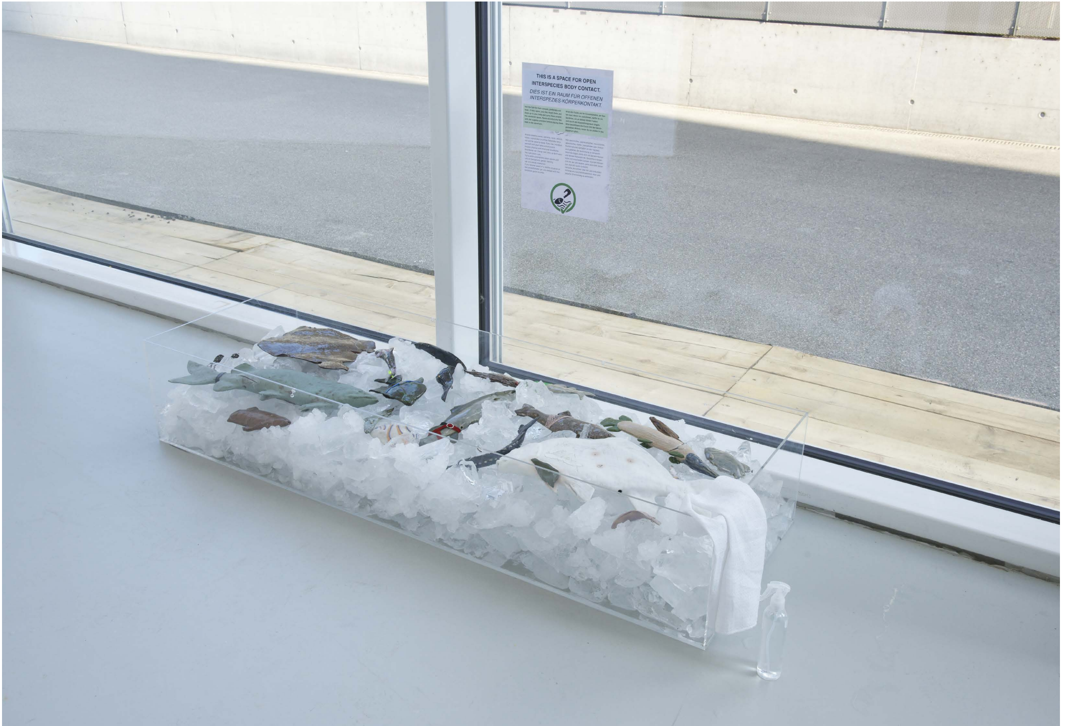
Ausstellungsansicht TANK IAGN 2023