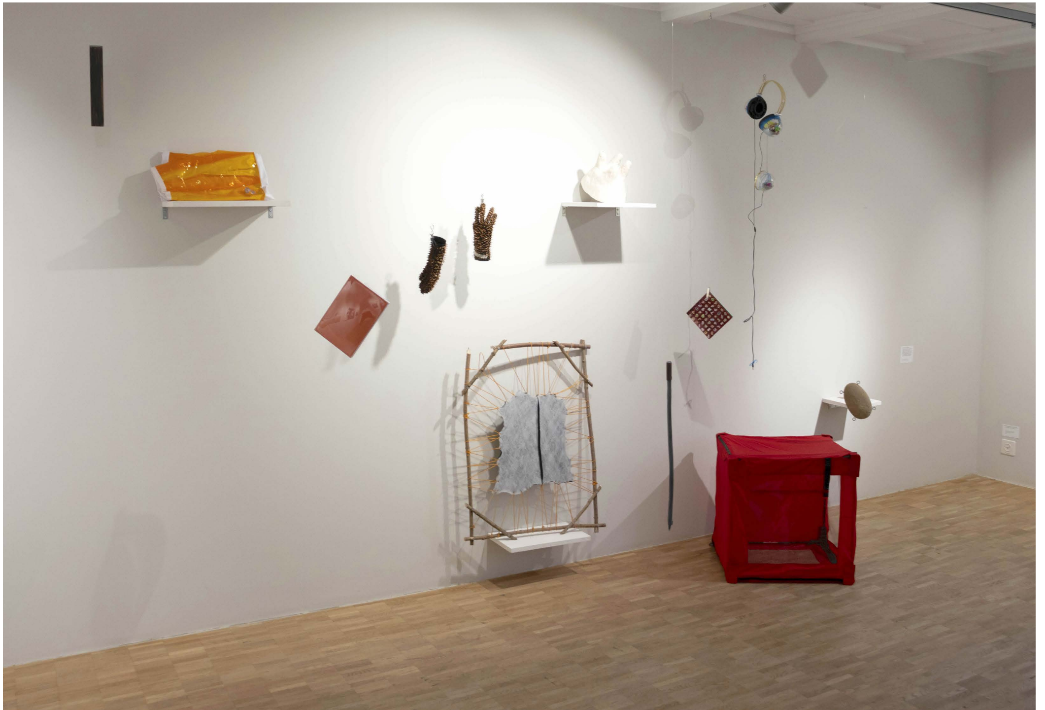
Ausstellungsansicht CRMI Langenthal 2022