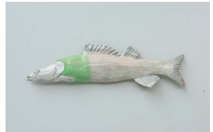
Haltefische 2023 Selection of sculptures