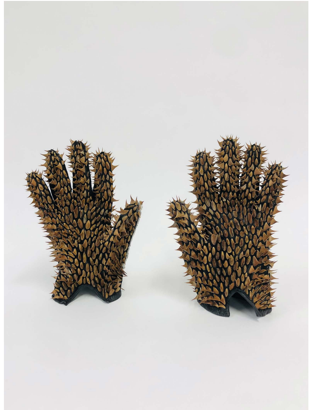
Dornhandschuhe 2022, leather gloves, dog rose thorns, ca. 20 x 15 x 10 cm each