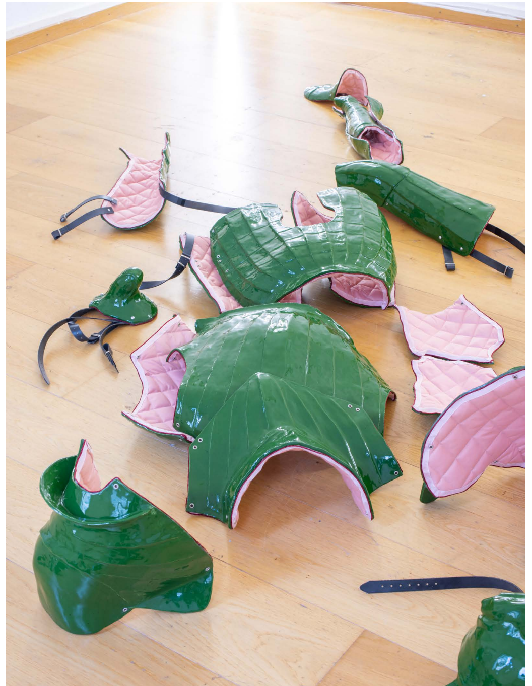
Rüstung 2024 Exhibition view (detail) at CC: Basel, 2024

Glazed ceramic, batting, cotton fabric, sewing thread, ribbon, faux leather straps, eyelets, metal fasteners Dimensions variable, roughly human-sized