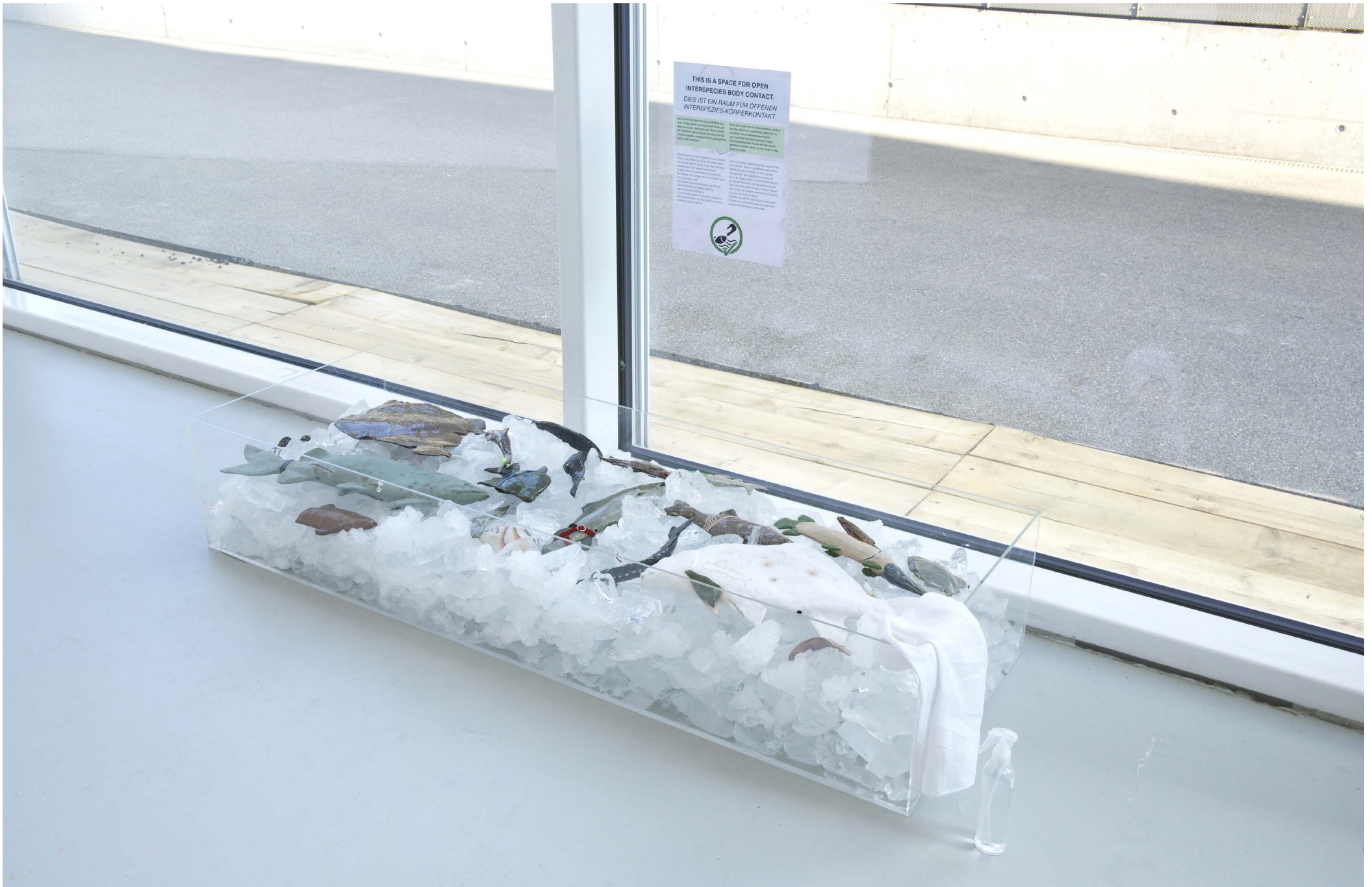
Haltefische 2023 Exhibition view at der Tank HGK Basel FHNW, BASIS 2023