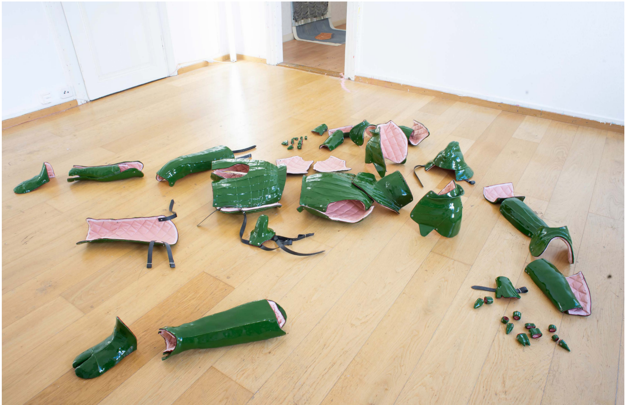
Rüstung 2024 Exhibition view at CC: Basel, 2024. Work visible by Max Gisel