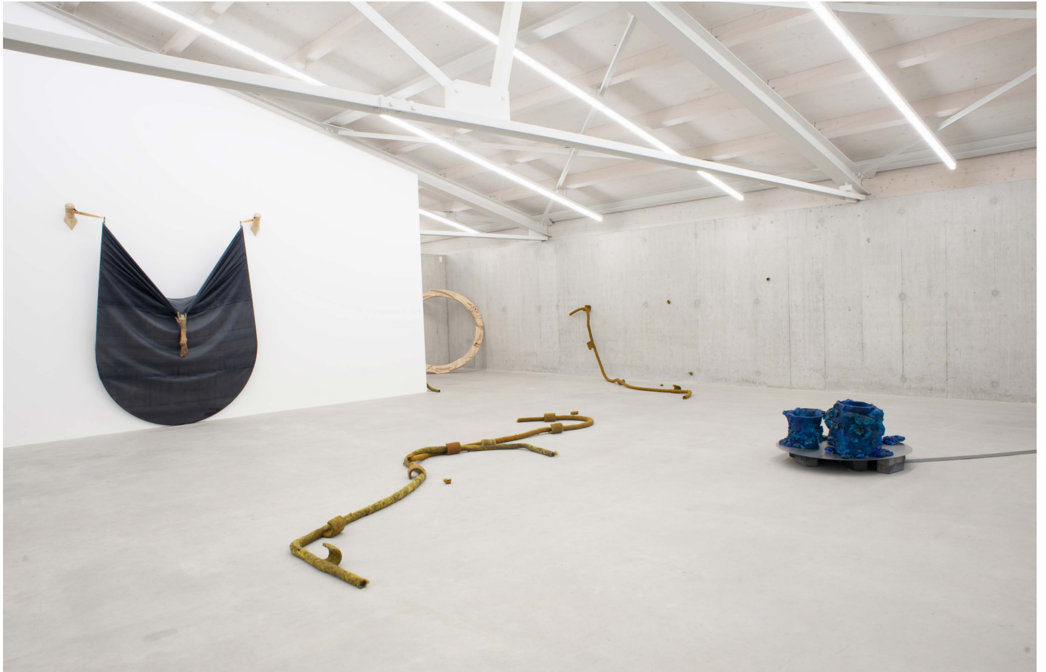
DIN 18065 (Handlaufen) 2024 Exhibition view at Kunsthhaus Baselland, 2024. Works visible by Odilia Senn and Timo Paris