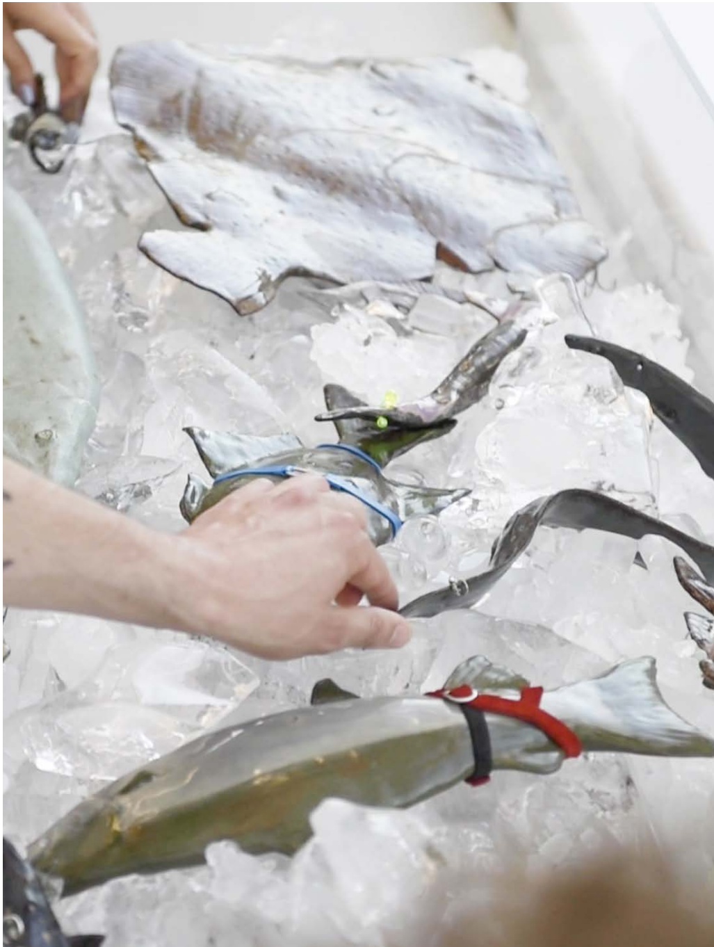
Haltefische 2023 Exhibition view / activation at der Tank HGK Basel FHNW, BASIS 2023

“THIS IS A SPACE FOR OPEN INTERSPECIES BODY CONTACT. Ask the fish for their consent, preferably out loud. If they agree, you may touch them, put them up to your body and carry them around the exhibition space.”