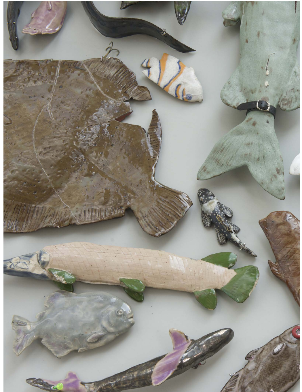
Haltefische 2023 (detail)

Activation (1:55min): https://youtu.be/IFM_veSovLQ