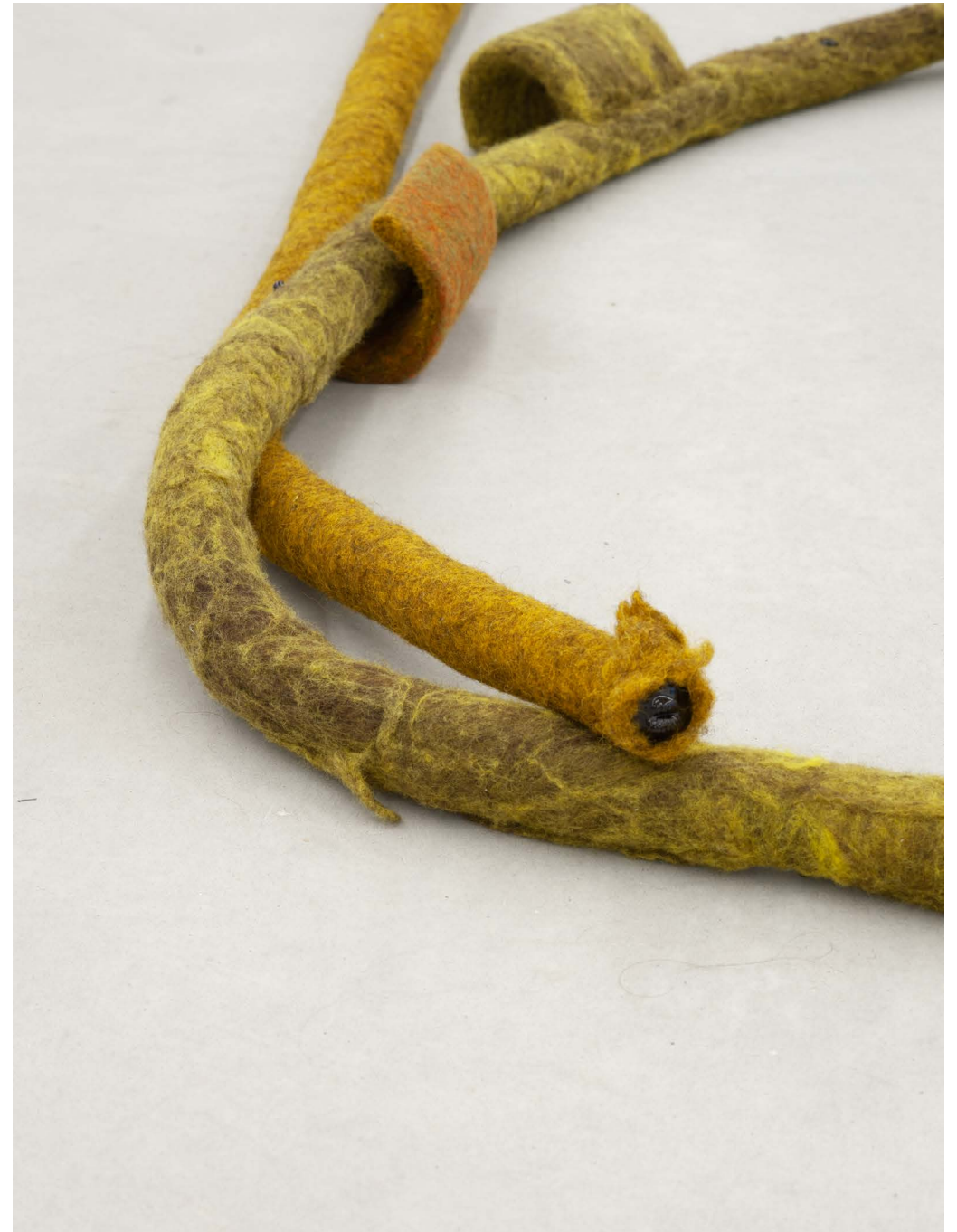
DIN 18065 (Handlaufen) 2024 Exhibition view (detail) at Kunsthaus Baselland, 2024

Felting wool, glazed ceramics Dimensions variable