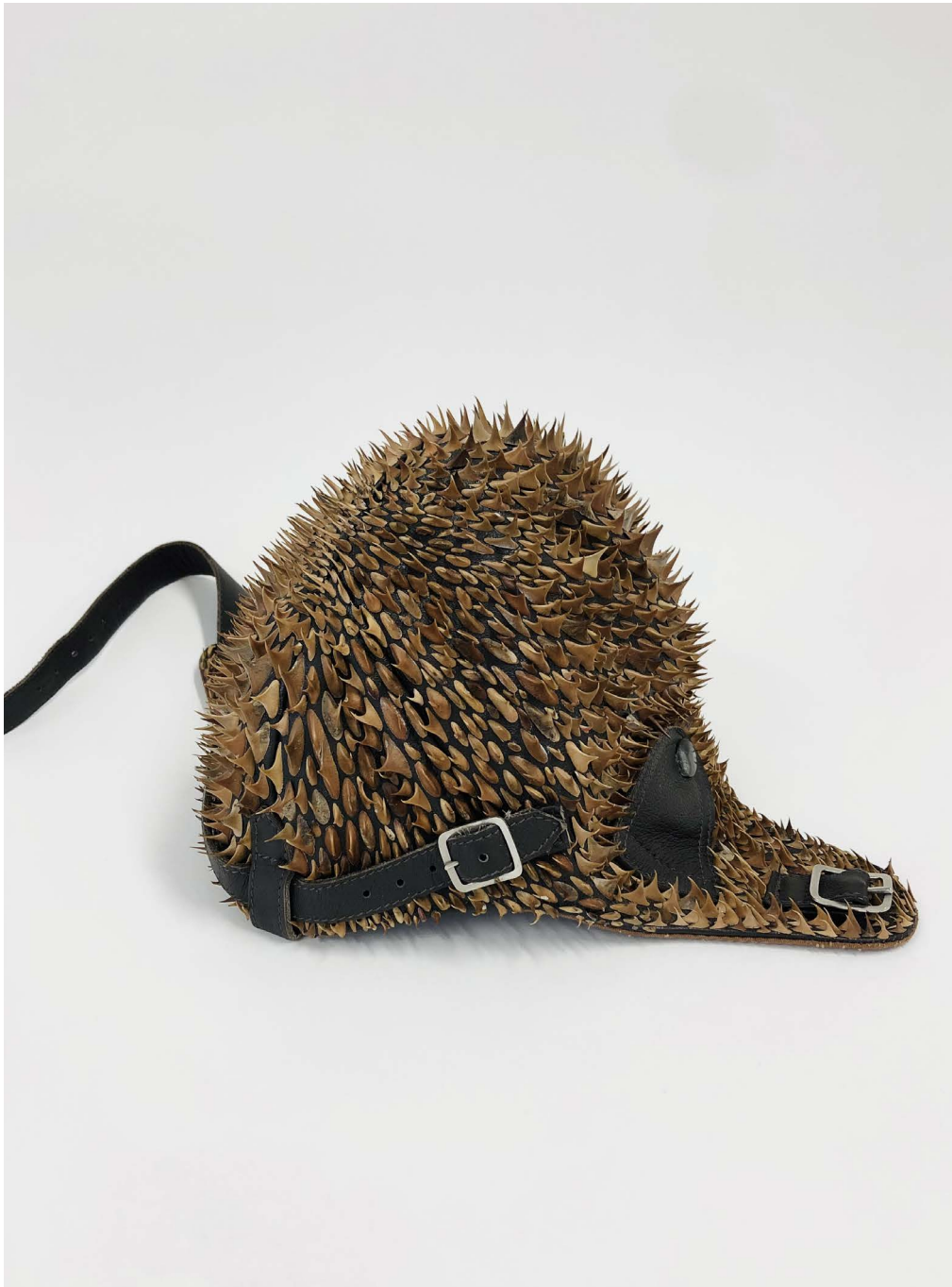
Dornenhelm 2023, leather cap, dog rose thorns, ca. 40 x 30 x 30 cm