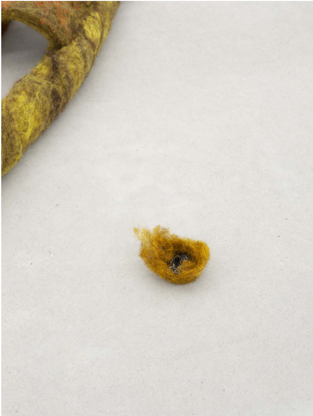
DIN 18065 (Handlaufen) 2024 Exhibition view (detail) at Kunsthhaus Baselland, 2024

A site specific confrontation with the normatively masculine architecture of the art space through challenging its form and material. A felt and ceramic duplicate of the handrail is growing off the wall onto the floor, its opposing material properties making it useless. Bringing versatile and organic form into a man made space designed for primarily one type of human body draws attention to those spacial elements that are habitually overlooked or taken for granted. The object becomes a body, closer to a plant or creature with life of its own.