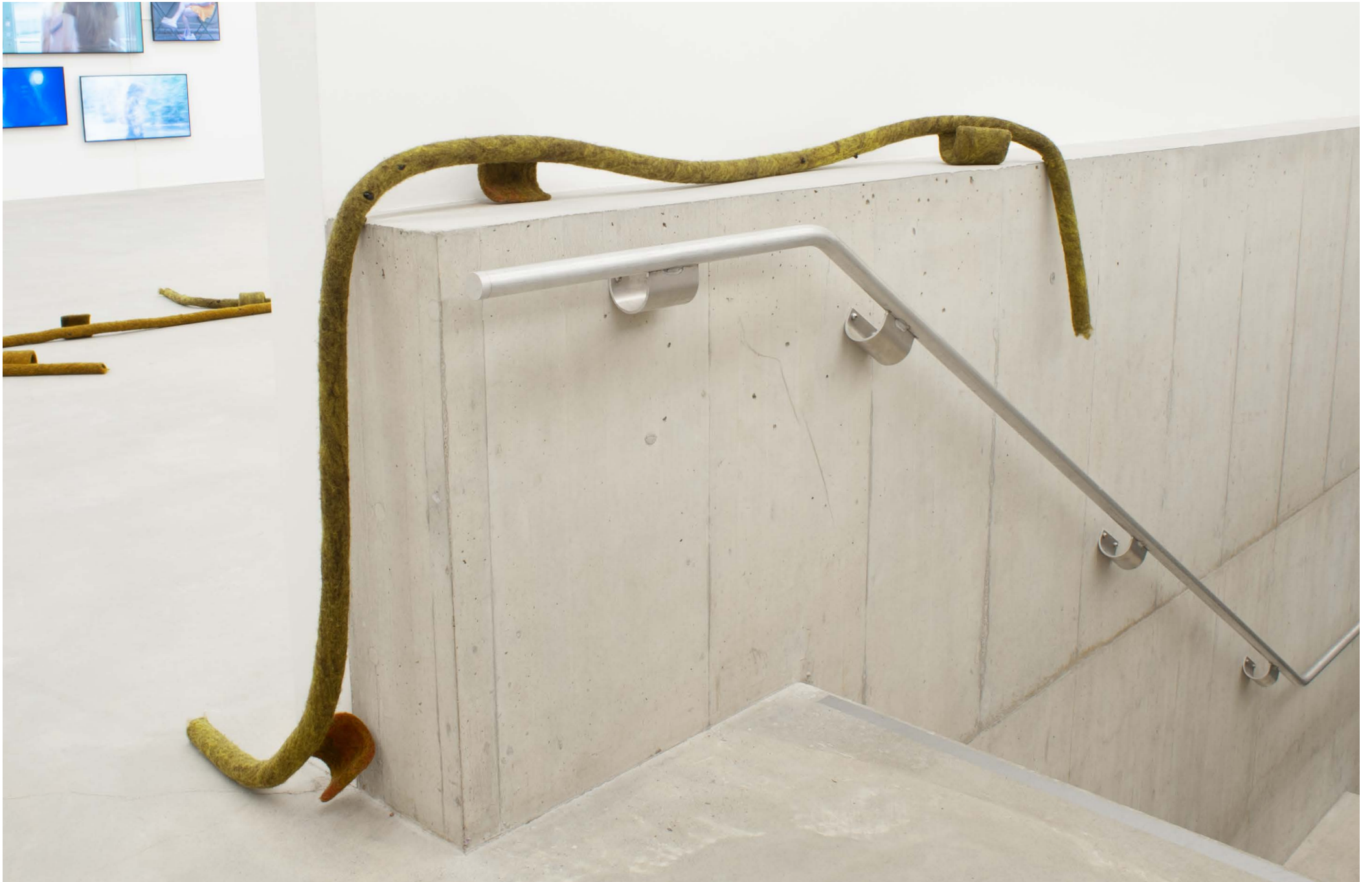
DIN 18065 (Handlaufen) 2024 Exhibition view at Kunsthau Baselland, 2024. Work visible by Nora Lune